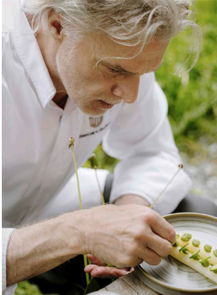
Lindner macht keine halben Sachen. Er ist ganz oder gar nicht dabei.

Absolut. Denn wir bieten eine moderne und abwechslungsreiche Küche an. Punktgastronomie ist nicht immer nur «Fine Dining und Pinzette», sondern beinhaltet