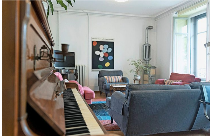
La pension est un hôtel hybride: 20 chambres sont louées au mois, 4 à la nuit et 4 sont à disposition de la Ville.

Aujourd'hui, la pension est un hôtel hybride. Sur les 28 chambres, 20 sont louées au mois et quatre à la nuit par le biais de plateformes comme Booking. Les prix sont attractifs (entre 550 et 850 francs par mois, ménage inclus) et attirent beaucoup d'étudiantes, ou des salariées qui font des missions ponctuelles dans la région. Quatre