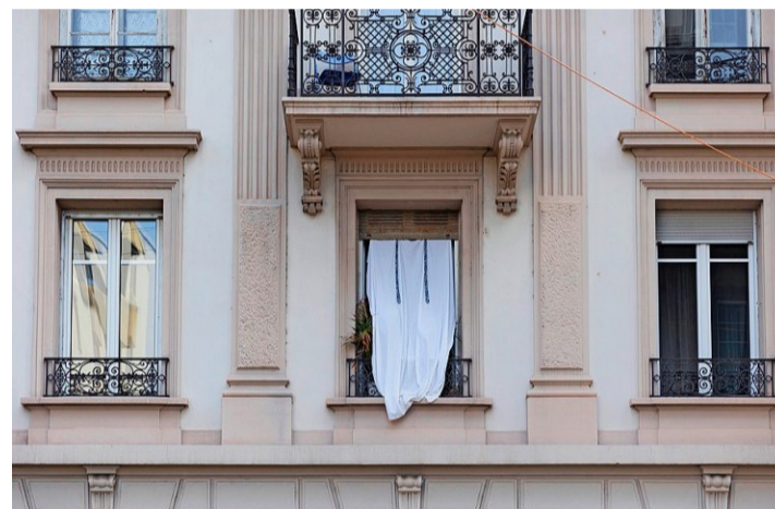
La Pension Bienvenue, à la rue du Simplon, a besoin d'un coup de jeune.

«Le fait que la pension soit réservée aux femmes est précieux. Cela nous permet d'y loger des femmes seules, qui ont des parcours difficiles ou qui sont victimes de violences.»