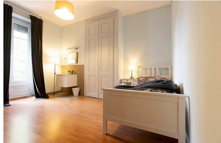
La majorité des chambres sont louées au mois, entre 550 et 850 francs par mois, ménage inclus.